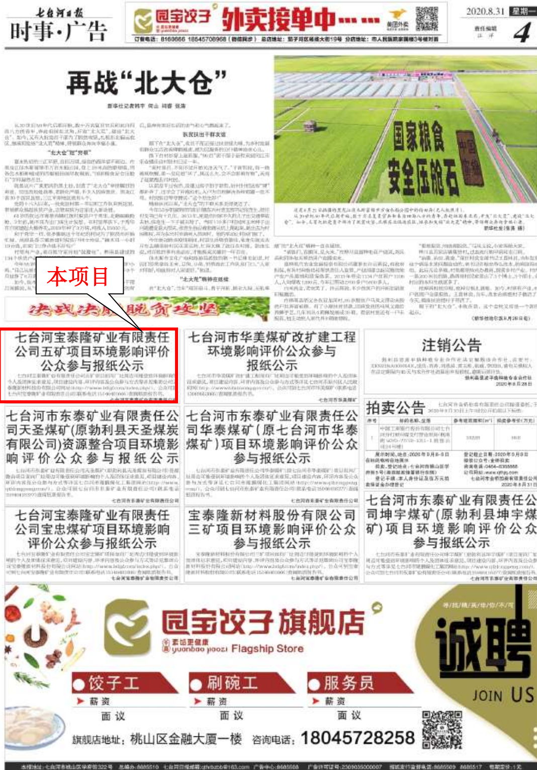
图 3.2 环评公参第一次报纸公示截图

10个工作日内公开信息次数为2次，符合《环境影响评价公众参与办法》（生态环境部令 第4号）中第十条、第十一条的规定。两次报纸公示情况截图见图3.2—3.5。原件存档备查。