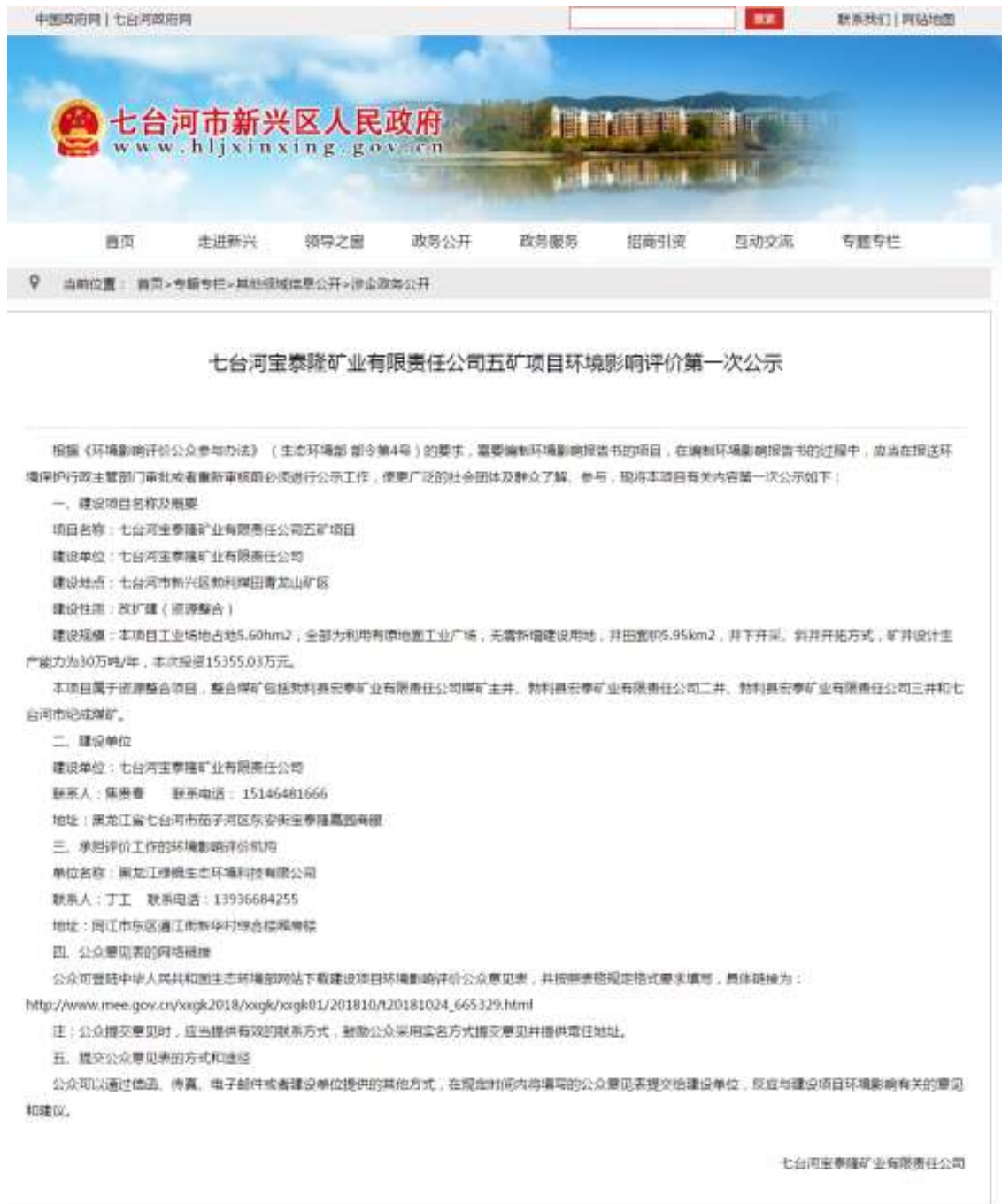
图 2.1 环评公参首次网站公示截图