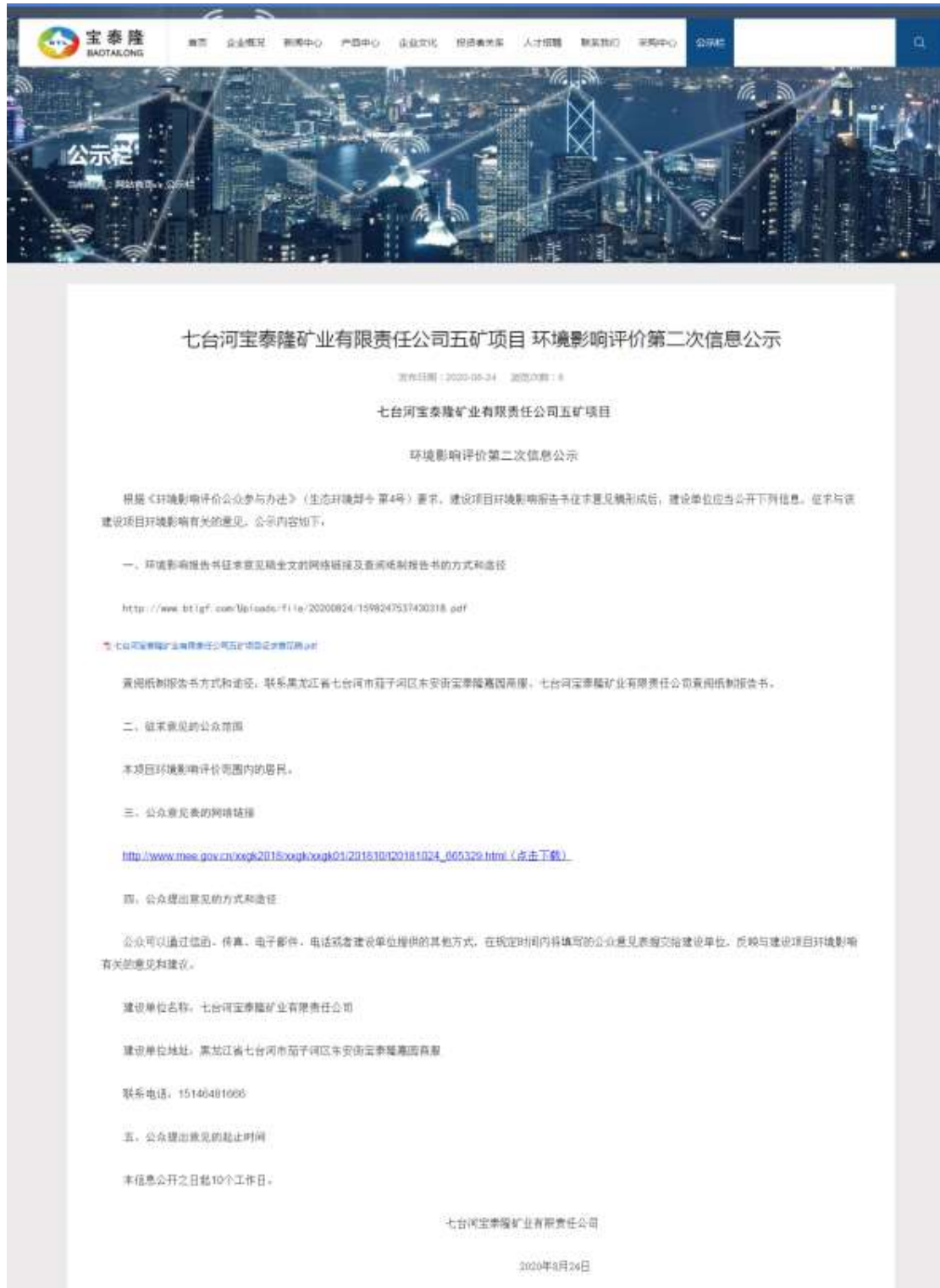
图 3.1 环评公参征求意见稿网站公示截图