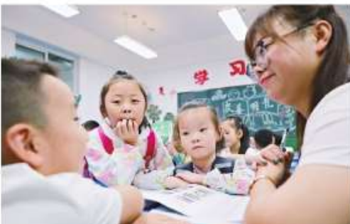
甘肃陇南：我们开学了

新华社北京8月26日电 日前，国务院联防联控机制印发《进一步推进新冠病毒核酸检测能力建设工作方案》。该方案提出，要推进新冠病毒核酸检测能力建设工作，全面提升核酸检测能力，切实保障人民群众生命安全和身体健康。 方案指出，要推进新冠病毒核酸检测能力建设工作，全面提升核酸检测能力，切实保障人民群众生命安全和身体健康。要推进新冠病毒核酸检测能力建设工作，全面提升核酸检测能力，切实保障人民群众生命安全和身体健康。要推进新冠病毒核酸检测能力建设工作，全面提升核酸检测能力，切实保障人民群众生命安全和身体健康。